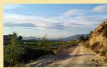
Camino de la Sierra del Cristo

Situada al Sur de la Provincia de Alicante, entre las pedanías de Orihuela, Hurchillo y Torremendo. La Sierra del Cristo es una pequeña elevación montañosa, estrecha y alargada de Este a Oeste. Tiene una longitud total de unos 8 kilómetros, con 500 m de anchura y su cota más elevada no alcanza los 272 m.