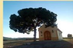
Ejemplar de Pino Piñonero

En las inmediaciones de la Ermita se nos presenta un gran ejemplar de pino piñonero.