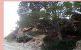
Vegetación de la zona