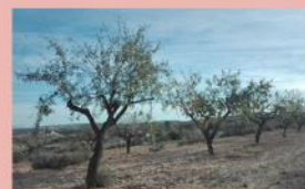
Cultivo de Almendros