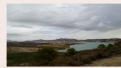
Paisaje de Envalse de la Pedrera

Se localiza al sur de la ciudad de Orihuela. El límite Oeste discurre paralelo a la carretera Orihuela-Torremendo. El límite Sur coincidiría con la carretera Torremendo-San Miguel de Salinas y la pedanía de Torremendo. Al Este limita con la carretera Orihuela-San Miguel de Salinas, mientras que al Norte cierra con la propia presa del Embalse y Arroyo Grande.