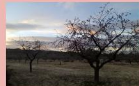
Cultivo de Almendros

Las plantaciones que se cultivan en la zona son el Almendro, el Olivo, el Algarrobo, la Higuera, la Vid, la Cebada, el Trigo y la Avena.