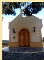
Ermita El Niño Jesús la Dehesa

Inaugurada el 26 de agosto del 2007 en honor a la Virgen del Carmen. La Ermita se encuentra en la Dehesa de Pinohermoso, término municipal de Arneva. Los vecinos formaron una comisión para realizar pequeños actos y recaudaron dinero para construir la Ermita.