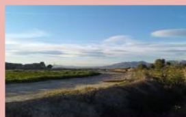
Cultivo de Aromaticas