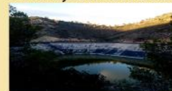
Balsa del Piojo

El Oeste de la Sierra del Cristo se encuentra en la Provincia de Murcia, en el Centro se denomina la Sierra del Piojo y el Nord-Este el Montejano.